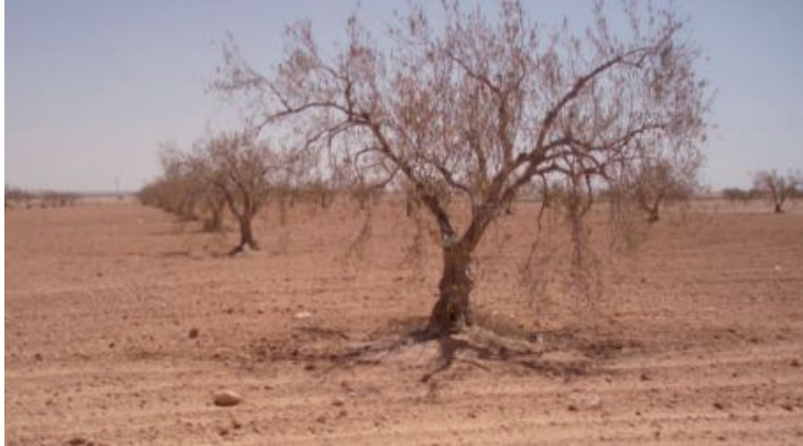
Paysage aride soumis à la désertification.