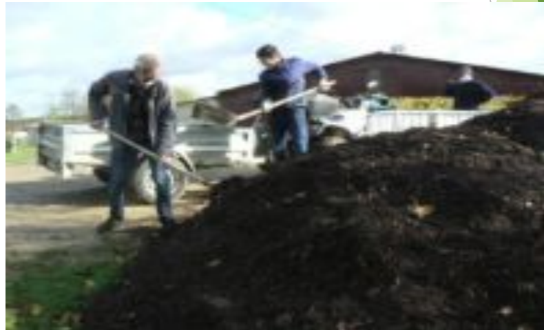
Compostage à l'échelle locale dans une ferme régénérative