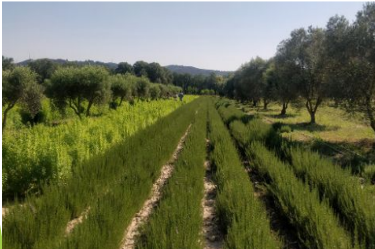
Système agroforestier en milieu aride en Tunisie