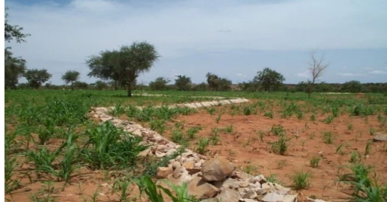
Cordons pierreux pour lutter contre l'érosion hydrique